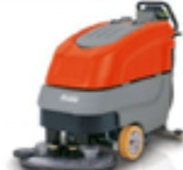
SCRUBMASTER B70 ARBETSBREDD ..... 65CM YTKAPACITET ..... 3000M 2 /H PLANDISK ELLER TVÅ CYLINDERBORSTAR