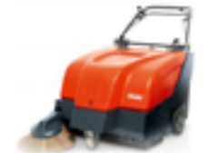
SWEEPMASTER 800 ARBETSBREDD ..... 67CM YTKAPACITET ..... 3350M 2 /H SOPLÅDA ..... 2 X 25L MOTORDRIFT - BATTERI ELLER BENZIN