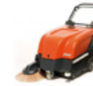
SWEEPMASTER 650 ARBETSBREDD ..... 50,5CM YTKAPACITET ..... 2500M 2 /H SOPLÅDA ..... 35L MOTORDRIFT - BATTERI ELLER BENZIN