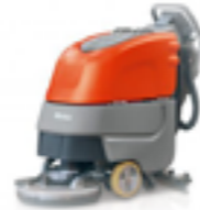
SCRUBMASTER B30 ARBETSBREDD ..... 43CM YTKAPACITET ..... 1900M 2 /H MED ELLER UTAN HULDRIFT