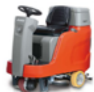
SCRUBMASTER B75 ARBETSBREDD ..... 55-65CM YTKAPACITET ..... 3500M 2 /H SMAL OCH SMIDIG