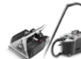
CLEAN PROFI 50.1 (+PROFI 55) TYP ..... MATTVÄTT TANKSTORLEK ..... 9L SMIDIG ALLRENGÖRING UTAN EFTERARBETE