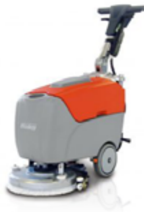
SCRUBMASTER B12 EVO ARBETSBREDD ..... 36CM YTKAPACITET ..... 1500M 2 /H LÄTTMANÖVRERAD - LÖSTAGBAR VATTENTANK