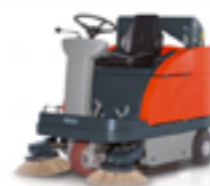
SWEEPMASTER 980 R/RH ARBETSBREDD ..... 120CM YTKAPACITET ..... 5800M 2 /H SOPLÅDA ..... 75L MED ELLER UTAN HYDRAULISK TÖMNING