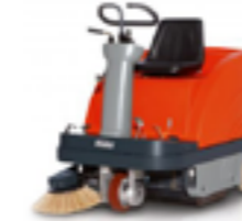
SWEEPMASTER 900 R ARBETSBREDD ..... 120CM YTKAPACITET ..... 5700M 2 /H SOPLÅDA ..... 60L ELEKTRONISK FILTERRENGÖRING