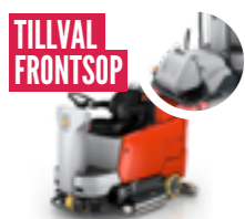
SCRUBMASTER B175 ARBETSBREDD ..... 85-108CM YTKAPACITET ..... 7560M 2 /H ENKEL HANTERING OCH UNDERHÅLL