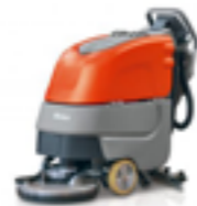
SCRUBMASTER B45 ARBETSBREDD ..... 43-65CM YTKAPACITET ..... 2900M 2 /H IDEALISK FÖR RENGÖRING UNDER EX HYLLOR