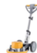
CLEAN ORBITAL TYP ..... MATTVÄTT TANKSTORLEK ..... 12L DJUPRENGÖRING AV MATTOR