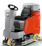
SCRUBMASTER B120 ARBETSBREDD ..... 70-90CM YTKAPACITET ..... 5800M 2 /H PLANDISK ELLER CYLINDERBORSTAR