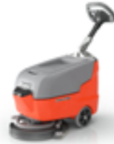
SCRUBMASTER B25 ARBETSBREDD ..... 43CM YTKAPACITET ..... 1700M 2 /H RYMS I DIN STÅDSKRUBB