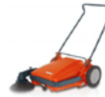
SWEEPMASTER M600 ARBETSBREDD ..... 67CM YTKAPACITET ..... 2300M 2 /H SOPLÅDA ..... 40L HELT MEKANISK