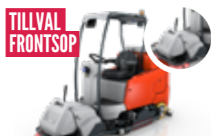
SCRUBMASTER B260 ARBETSBREDD ..... 108-123CM YTKAPACITET ..... 8600M 2 /H SMARTA TILLBEHÖR