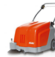
SWEEPMASTER B500 ARBETSBREDD ..... 60CM YTKAPACITET ..... 2400M 2 /H SOPLÅDA ..... 40L INKL. FILTER OCH SUGMOTOR