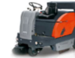
SWEEPMASTER 1200 RH ARBETSBREDD ..... 147CM YTKAPACITET ..... 9300M 2 /H SOPLÅDA ..... 130L HYDRAULISK TÖMNING