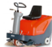
SWEEPMASTER 800 R ARBETSBREDD ..... 89CM YTKAPACITET ..... 5340M 2 /H SOPLÅDA ..... 50L LÄTTMANÖVRERAD